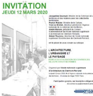
L'architecture, l'urbanisme et le paysage pour la revitalisation des centres des villes petites et moyennes ANCT et Ensa Clermont-Ferrand, Paris, 12 mars 2020