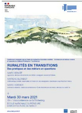
Conférence Ruralités en Transitions Pratiques et métiers en questions 30 mars 2021