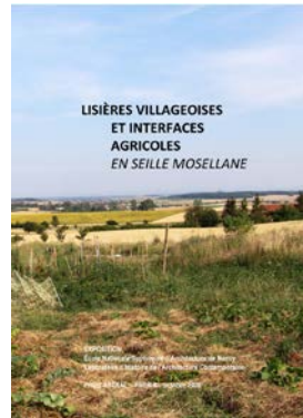
Exposition Lisières villageoises et interfaces agricoles Octobre -Novembre 2021 Ensa Nancy