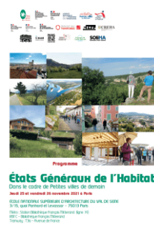
Les Etats Généraux de l'Habitat ANCT et Fédération des PNR, Paris, 25-26 novembre 2021