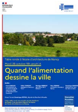
Table-ronde Quand l'alimentation dessine la ville 26 octobre 2021