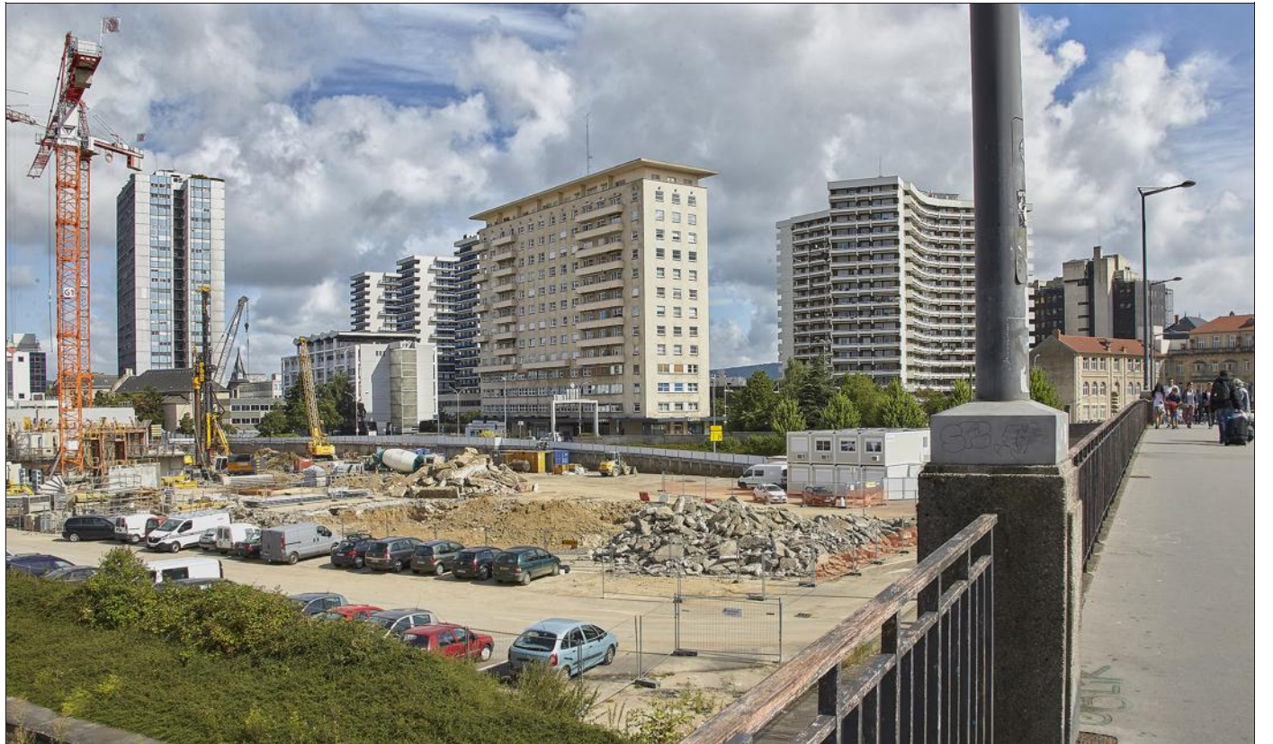
■ La nouvelle voie arrivera au milieu du pont des Fusillés, depuis la synagogue.

Les plans du concepteur du quartier Nancy Grand