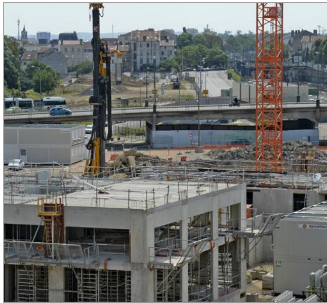
■ Nancy Grand Cœur va changer le visage de la ville.

La ville de Nancy n'a pas connu pareille transformation depuis la Renaissance, quand les architectes de Charles III ont dessiné une ville « neuve » en damier, à côté des ruelles tortueuses de la vieille ville. Stanislas a fait le lien entre la ville vieille et la ville neuve, en construisant la place et le quartier qui portent son nom. Pas grand-chose n'avait été édifié, depuis, de ce côté des voies ferrées. En nombre de bâtiments nouveaux et de mètres carrés construits, le programme baptisé Nancy Grand Cœur est impressionnant ! Plus de 55.000 m 2 de surface de plancher à construire. 17.400 m 2 consacrés à des activités tertiaires. 1.710 m 2 à des activités commerciales