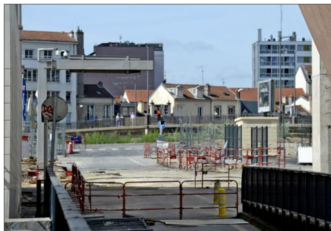
■ La rue Charles-III ira droit jusqu'au pont des Fusillés raccourci. Respectant le plan en damier de la Renaissance.

Onze hectares en plein centre-ville, 165.000 m 2 de planchers à construire, dont 55.000 m 2 de bureaux et commerces, ainsi que 700 logements. La Zone d'aménagement concertée (ZAC) Nancy Grand Cœur permettra de relier l'ancien no man's land des terrains SNCF à la ville « neuve » de Charles III.