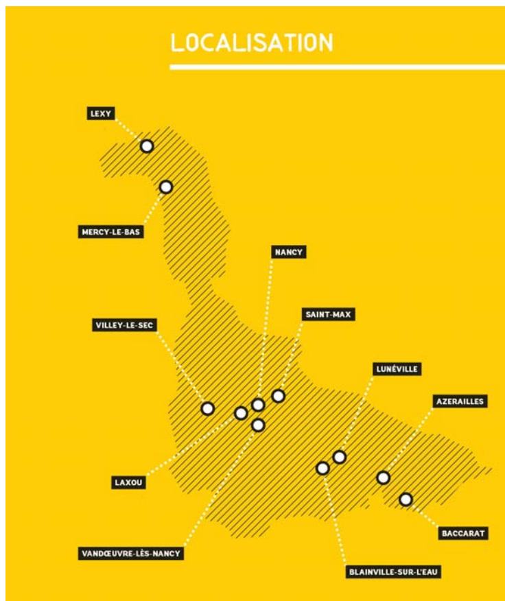
Design graphique : Studio Pankat

Elle offre également une vision complémentaire des avant-gardes architecturales dans le département.