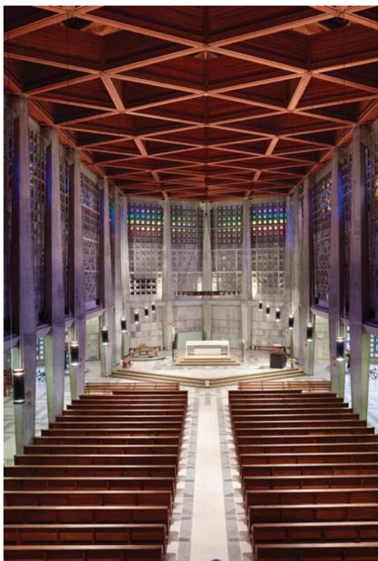
Vue vers le chœur de l'église Saint-Remy de Baccharat Crédits : Arch. N.Kazis / Ph. G.André © Région Lorraine - Inventaire général

CITÉ DE L'ARCHITECTURE &amp; DU PATRIMOINE | SALLE VIOLLET-LE-DUC