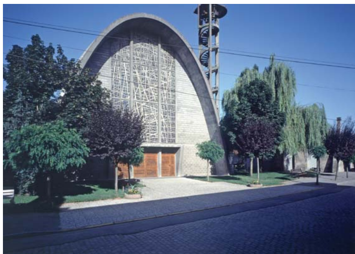
Église Saint-Léopold de Lunéville Crédits : Arch. P.Jacquot, E.Aubry