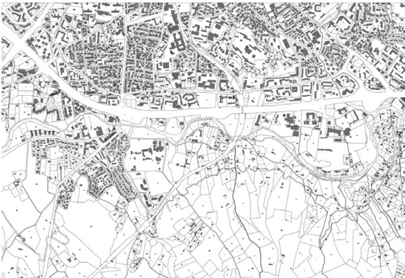
Territoire d'exploration, les quartiers Sud d'Aix-en-Provence